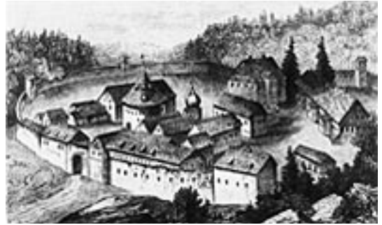
Das Waldorf Zillbach