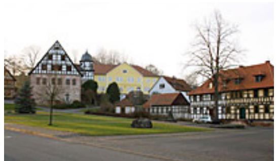
Heinrich Cotta Platz - Zillbach